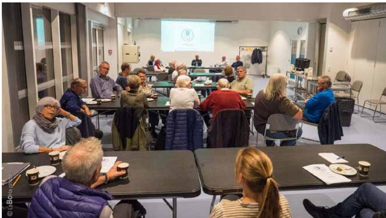
Fremmødte på AAIG hovedgeneralforsamling 29. sept. i Arena Aabenraa

AAIG hovedgeneralforsamlingen i år blev meget speciel, da det blev til 3 forskellige datoer.