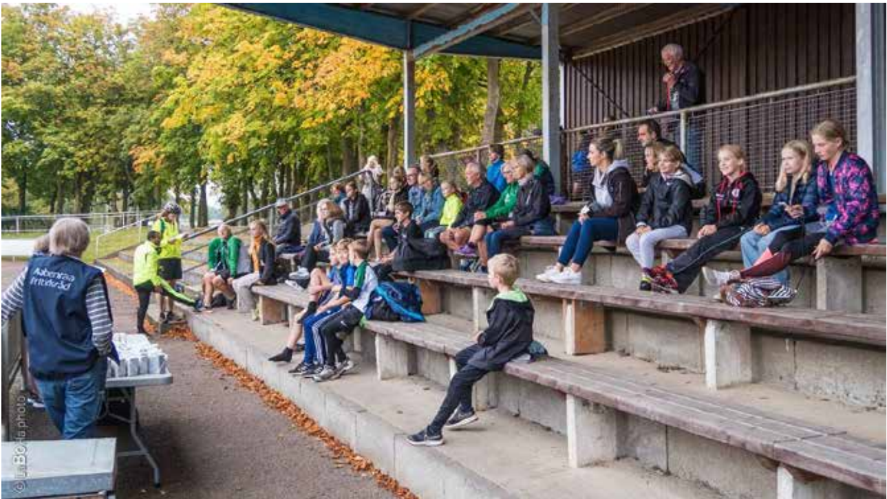
Fremmødte AAIG-atm erkendtlighedsmodtagere på stadions tribune.

Årets erkendtlighedsoverrækkelse blev noget anderledes end forventet.