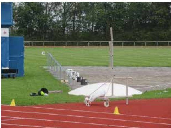
Kugleramme – øh kuglerille, en smart ting på Randers stadion

Normalt er det et omfattende stævne for ungdom fra 12-22 år, men stort set intet har jo været normalt. Det endte med at forbundet og Randers valgte kun at afvikle det for grupperne 12 år og 13 år, bl.a ud fra, at de ældre grupper havde afholdt danske ungdoms mesterskaber. Dette mesterskab findes ikke ved de yngre.