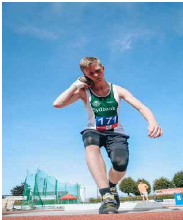
Bastian til DMU i Hvidovre