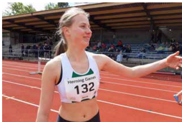
Mie fører stadig sprintdistancerne